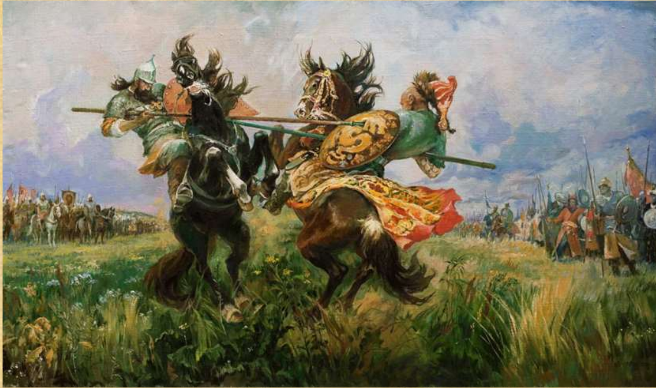
Дмитрий Донской и монах Пересвет